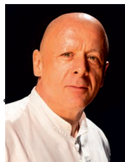
Thierry Marx Chef étoilé du Mandarin Oriental

CUISINE MODE D'EMPLOI(S) LA FORMATION AUX MÉTIERS DE LA RESTAURATION AVEC THIERRY MARX